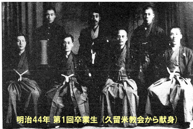
明治44年 第1回卒業生 (久留米教会から献身)