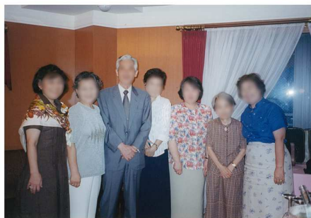
2001年大学院における特別講義