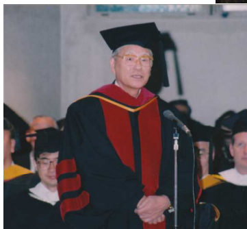
故石原寛前理事長